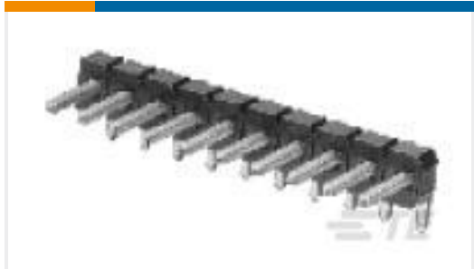
TE 零件编号825437-6 MOD II HDR R.A.