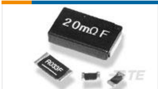
TE 零件编号4-1625827-8 TL3A R068 1% 2K RL