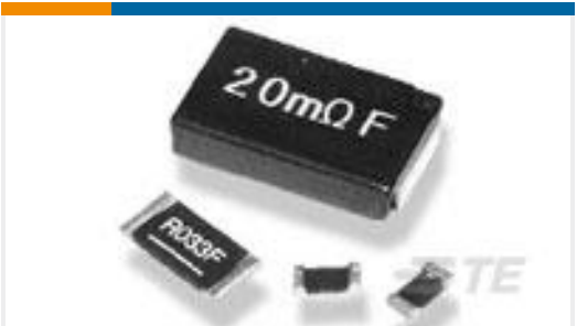
TE 零件编号1625827-8 TL3A R033 1%