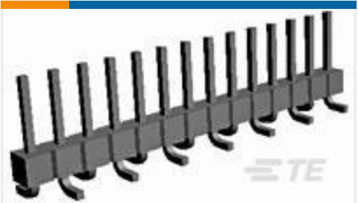
TE 零件编号1241150-4 4P MOD II BREAK AWAY HDR , SMD, BLISTER