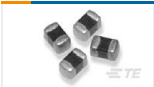
TE 零件编号1624117-5 BMB-A 0805 120R N4