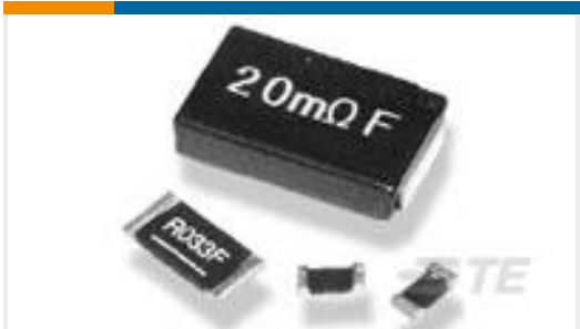
TE 零件编号1625827-9 TL3A R047 1%