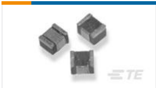
TE 零件编号3-1624113-5 3650 2A 27nH 5% 2K RL