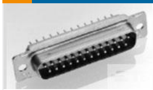
TE 系列/零件编号1757827-4 AMPLIMITE, PLUG ASY, POSTD, 109, ZN, 4