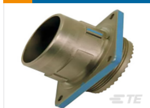
TE 系列/零件编号 YDIV44E11-99SNC009 RECP ASSY