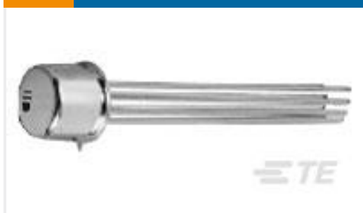
TE 系列/零件编号1-1617122-2 JMADC-26XM = M39016/15-081M