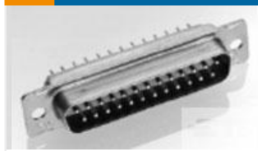
TE 系列/零件编号1757828-3 AMPLIMITE, RCPT ASY, POSTD, 109, ZN, 3