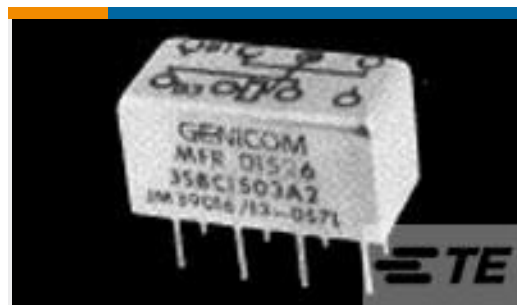
TE 系列/零件编号2-1617072-2 3SBC1503A2 = M39016/13-057L