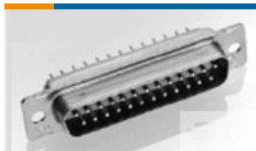
TE 系列/零件编号1757827-2 AMPLIMITE, PLUG ASY, POSTD, 109, ZN, 2