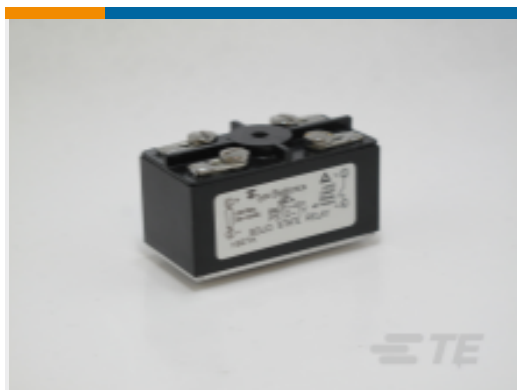
TE 系列/零件编号6-1618386-9 PS12-1Y = SOLID STATE RELAY, 10A/250VAC