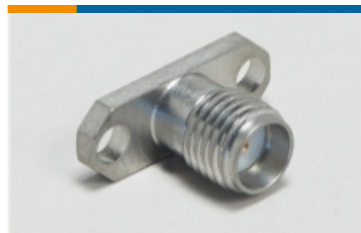
射频连接器发射器(3)