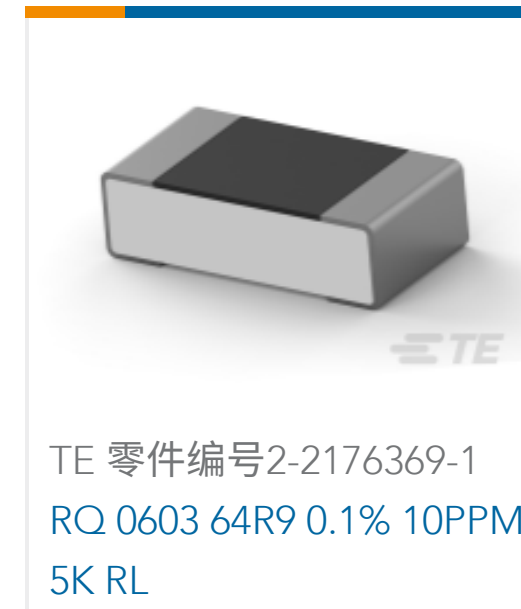
TE 零件编号2-2176369-1 RQ 0603 64R9 0.1% 10PPM 5K RL