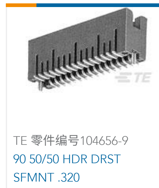
TE 零件编号104656-9 90 50/50 HDR DRST SFMNT .320