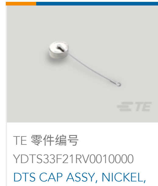
TE 零件编号 YDTS33F21RV0010000 DTS CAP ASSY, NICKEL, SIZE 21 RCPT