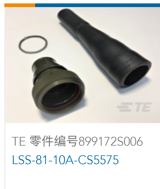
TE 零件编号899172S006 LSS-81-10A-CS5575