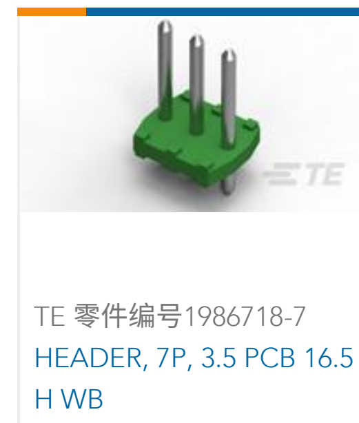
TE 零件编号1986718-7 HEADER, 7P, 3.5 PCB 16.5 H WB