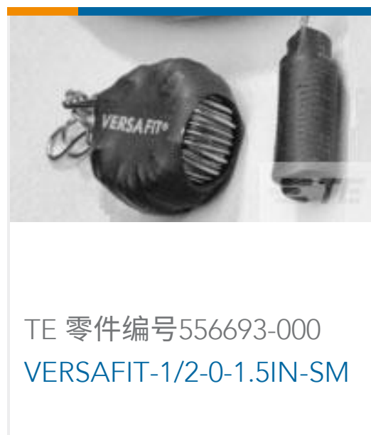
TE 零件编号556693-000 VERSAFIT-1/2-0-1.5IN-SM