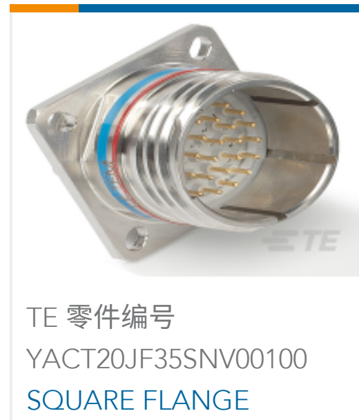
TE 零件编号 YACT20JF35SNV00100 SQUARE FLANGE RECEPTACLE