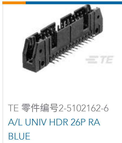
TE 零件编号2-5102162-6 A/L UNIV HDR 26P RA BLUE