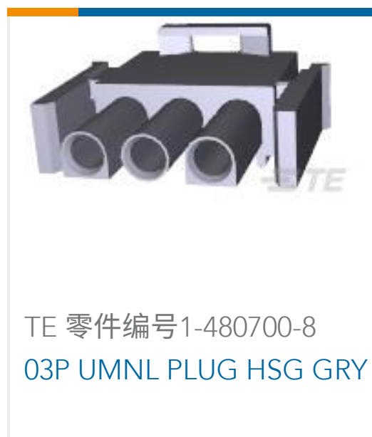
TE 零件编号1-480700-8 03P UMNL PLUG HSG GRY