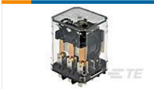
TE 零件编号1-1393116-1 KUM-11D59-24=KU