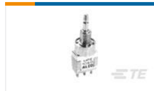
TE 零件编号4-1437567-2 MPE106D=(MSPE) SW P/B WATERPRO