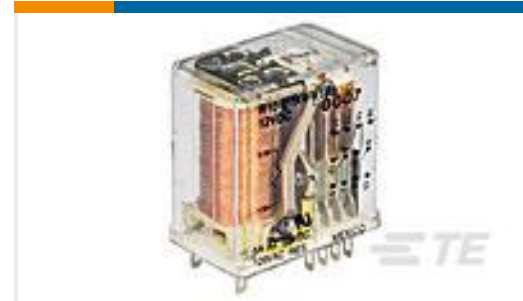
TE 零件编号1-1393767-7 R10-E2X4-V185=R10