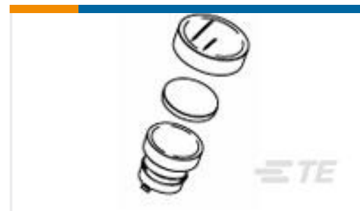
TE 零件编号7-1437569-2 64E2=COLOR PB CAP RED ROUND