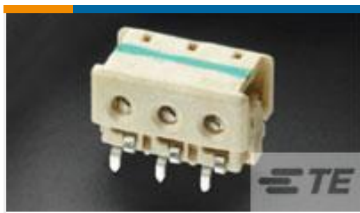
TE 零件编号2106751-3 Connector, Thru Hole-IDC, 3 pos, 18AWG