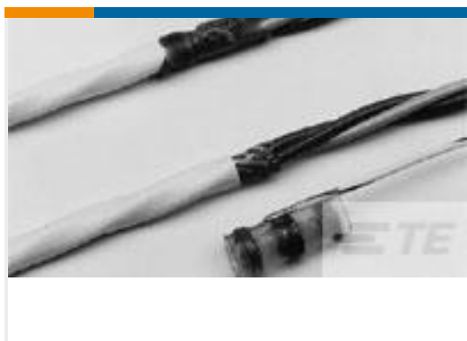
TE 产品编号403289-000 CWT-3