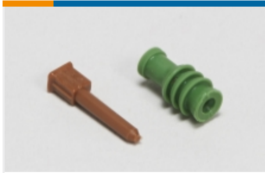
汽车密封件和盲堵(11)