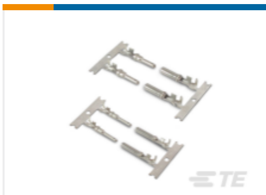
TE 产品编号1060-14-0122 DEUTSCH 冲压成型端子