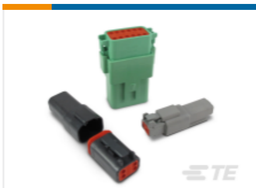
TE 产品编号DT04-6P-CE02 DEUTSCH DT 壳体